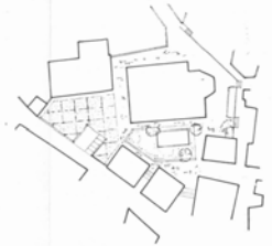
2 PLAZA DE LA IGLESIA Tratamiento mixto