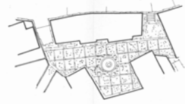
4 CALLE DEL CARMEN Tratamiento urbano

4. TIPOS DE TRATAMIENTO: Ver ficha de espacios libres en normativo.