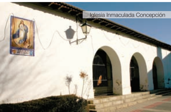
Iglesia Inmaculada Concepción

Formerly the town was called Zarzoso and later changed its name to Villavieja. According to the most credible version, this was due to the fact that the current village centre was founded on the ruins of an old house of Muslim or Jewish origin (currently the Mudejar arch). Back in the 20th century, on the 19th of July, 1916, official approval was finally granted for the new name: Villavieja del Lozoya. There are three factors suggesting the existence of Arab settlers in Villavieja prior to the Christian conquest of the region: the existence of the above-mentioned Mudejar gate, the construction of water channels dating back to the period of Arab domination, and the references to this village found in the Ordinance of 1485 and in the Inventory of 1492 (of the assets of Jews following their expulsion). Furthermore, given the existence of a great number of property owners, one can assume that there was a substantial stable population. We also arrive at the same conclusion based on the remains of a 15th century chapel, the building of which would have been justified by the existence of a significant population.