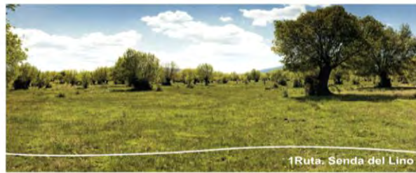
1Ruta. Senda del Lino