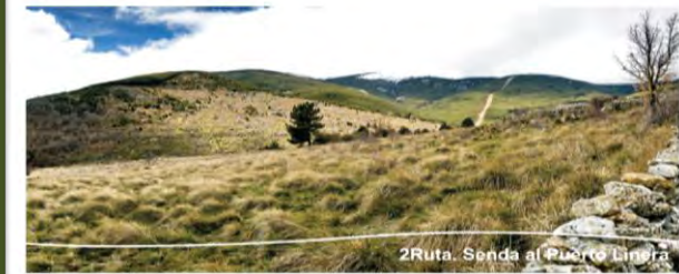
2Ruta. Senda al Puerto Linera