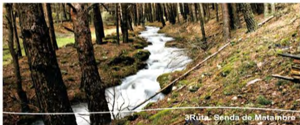
3Ruta. Senda de Matambre